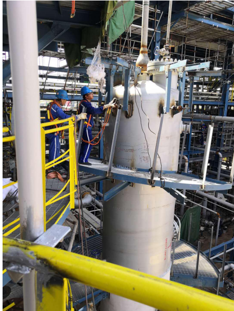
工人将安全绳挂在 D105 顶压力表引线手法上