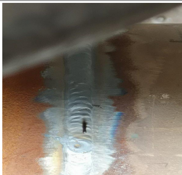
加裂空冷 A202A 东侧除盐水进水管线三通焊缝有漏洞。徐子涛