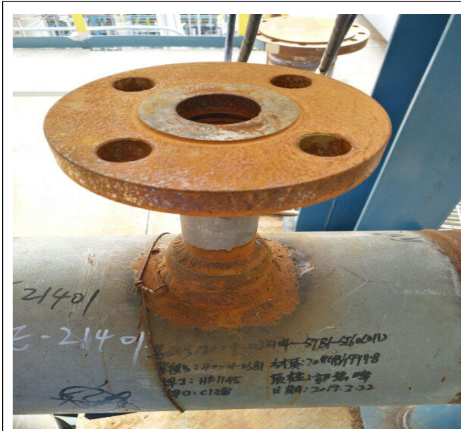
加裂A~203 出口热偶法兰敞口且密封面破损严重。马微