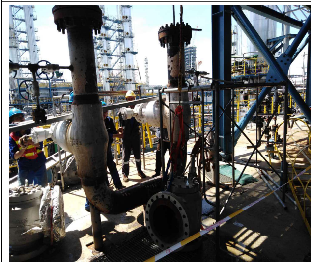
液力透平出口安全阀的入口法兰口等级低，需要设备确认 徐波