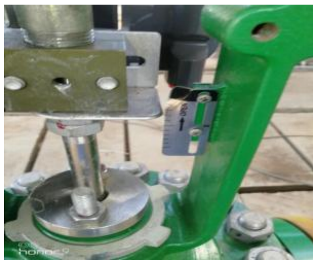
气分 FV30 201 控制阀阀体的刻度尺弯曲 陈金龙