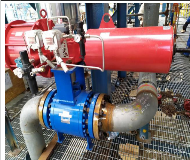
1041-D204 油相抽出线紧急切断阀 UV20601 装反 王际尘