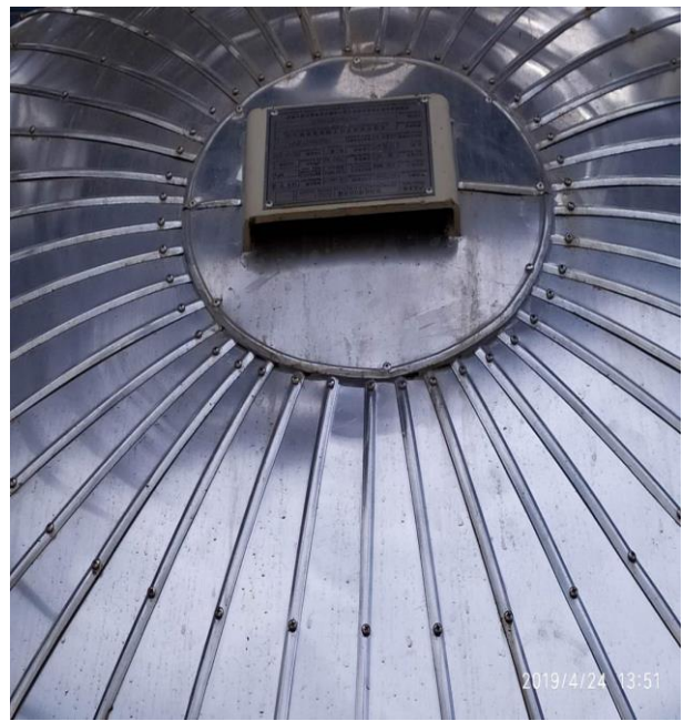
1041-D202 铭牌安装反了 王际尘