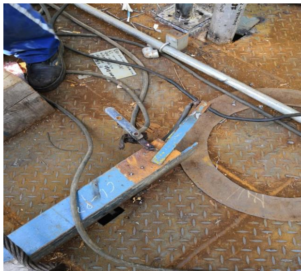
E202B 东侧电焊机地线接地夹子老旧,工作时过热,将旁边电线外皮融化冒烟