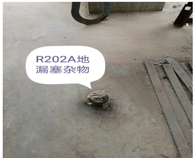
气分 R202A 地漏塞杂物 方云英